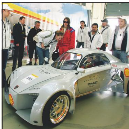
DESIGNPRIS: Østfoldstudentene vant konkurransens designpris.